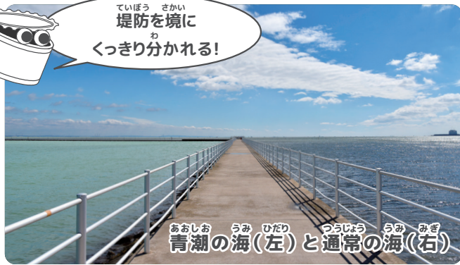
青潮の海(左)と通常の海(右)

海の広い範囲から酸素がほとんどなくなってしまう。さらに、空気中からわずかに溶け込んだ酸素も、海底からのぼってきた成分と反応して、青潮特有の白っぽい濁りになり、なくなってしまう。酸素は、生きものが生きていくためには欠かせません。青白く濁ったエメラルドグリーンの海面は一見美しく見えますが、実は生きものが生きられない海になっているのです。