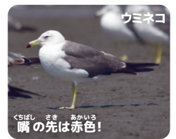
ウミネコ 胸の先は赤色!

夏になると三番瀬にたくさんやって来るウミネコ。「ミャーオ」と猫のような声で鳴くことからこの名が付けました。日本では普通種ですが、世界的には珍しい野鳥です。(大谷)